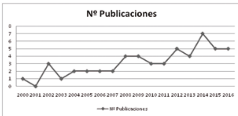
Figura 1. Número de publicaciones de 2000 a 2016.