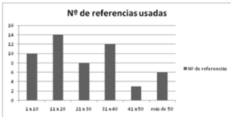
Figura 4. Número de referencias usadas por las publicaciones.

Como hemos remarcado anteriormente, a pesar de que los artículos analizados usan un buen número de referencias en las publicaciones, éstas no guardan relación con el número de veces que son citados en otras publicaciones. Esto se deduce dado que 43.4% de las publicaciones no es usada como referencia en otro artículo en ningún momento, análisis que queda reflejado en la figura 5, con una tendencia decreciente.