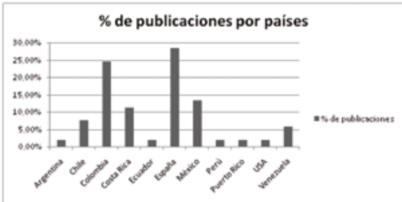
Figura 3. Porcentaje de las publicaciones por país de procedencia.

A continuación podemos ver plasmado en la figura 4 el número de referencias utilizadas en las publicaciones, de modo que la mayoría presentan una base científico-teórica bastante sólida, aunque se da la presencia de 19% de publicaciones que no usan más de diez referencias.